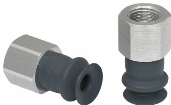
FSGA 14 NK-45 G1/8-IG