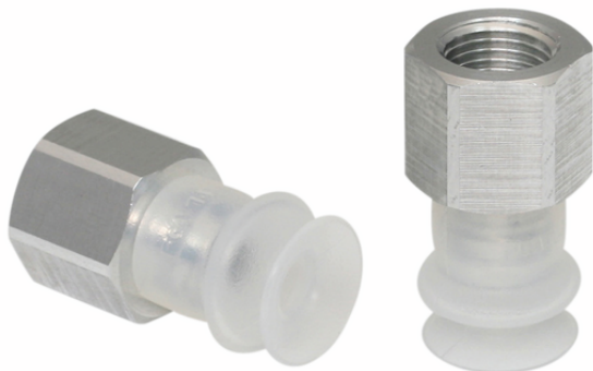
FSGA 14 SI-55 G1/8-IG