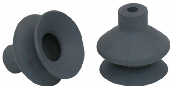
FGA 25 NK-45 N016