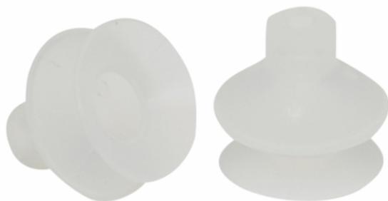
FGA 25 SI-55 N016