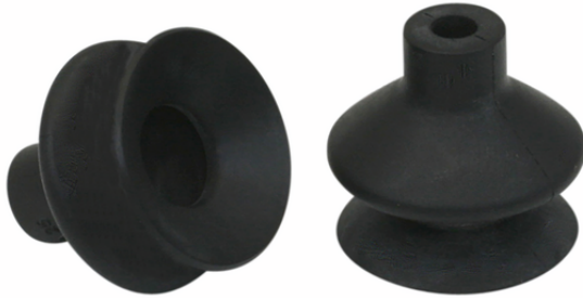
FGA 25 NBR-55 N016