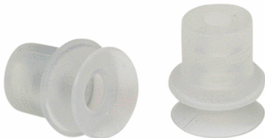
FGA 14 SI-55 N016