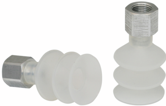
FSG 25 SI-55 G1/8-IG