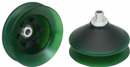
FSGA 85 VU1-72 G1/4-AG