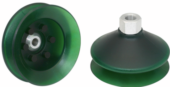
FSGA 85 VU1-72 G1/4-IG