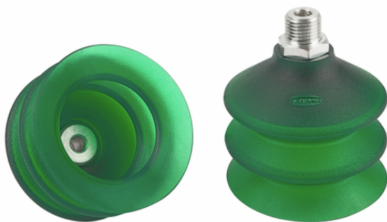
FSG 60 VU1-72 G1/4-AG