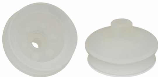
FGA 78 SI-55 N019