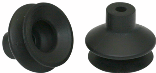
FGA 22 NBR-55 N016