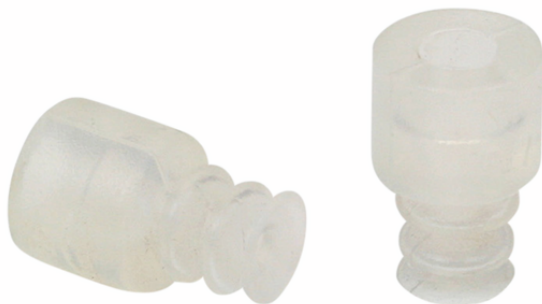
FG 7 SI-55 N016