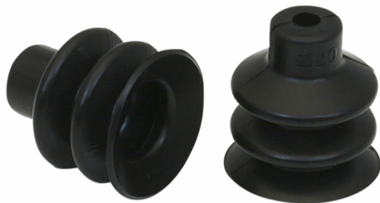
FG 20 NBR-55 N016