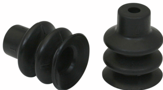
FG 18 NBR-55 N016