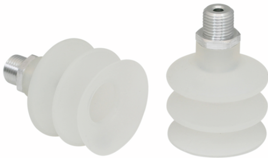
FSG 42 SI-55 G1/4-AG