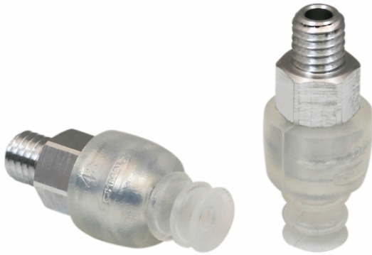
FSG 7 SI-55 M5-AG