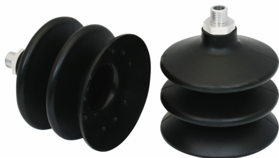
FSG 88 NBR-55 G1/4-AG

La ventosa FSG (parte in elastomero + nipplo di connessione) viene fornita non montata (montata a partire da un diametro di 32 mm). La fornitura è costituita da: