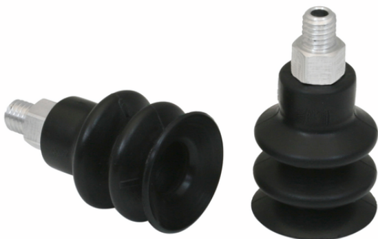
FSG 18 NBR-55 M5-AG

真空パッド FSGは、パッドにネジが取り付けられた状態で納品されます（直径32mm以上から組立式）。以下の製品で構成されます。