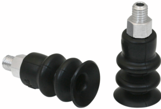
FSG 14 NBR-55 M5-AG

La ventosa FSG (pieza elastomérica + boquilla de conexión) se suministra desmontada (se monta a partir de un diámetro de 32 mm). El suministro se compone de: