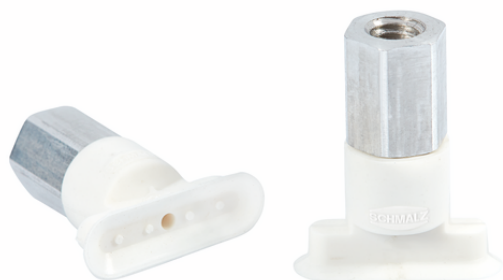
SGON 18x6 SI-HD-65 M5-IG