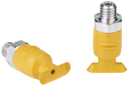
SGON 12x4 NBR-ESD-55 M5-AG

真空パッド SGONは、パッドにネジが取り付けられた状態で納品されます。以下の製品で構成されます。