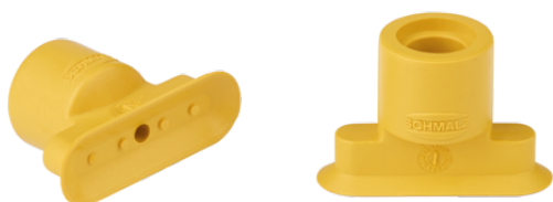
SGO 18x6 NBR-ESD-55 N021