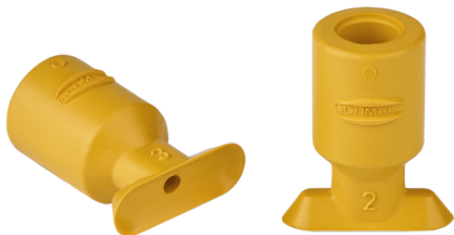
SGO 12x4 NBR-ESD-55 N020