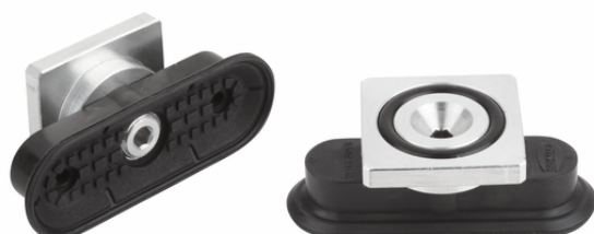
SAOF 60x23 HT2-65 RA

長円フラット真空パッド SAOF-HT2: 様々なサイズをラインアップ、ニップルが取り付けられた状態で納品されます。