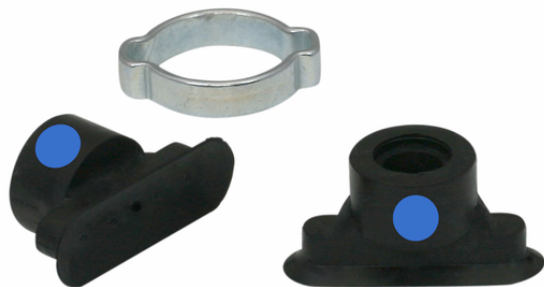
SGO 24x8 NBR-CO-55 N022