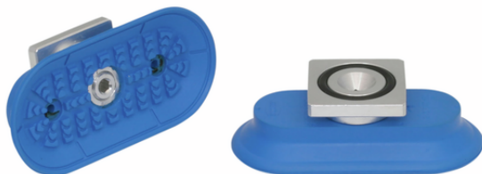
SAOF 80x40 NBR-45 RA

La ventouse SAOF, disponible en différents diamètres, est livrée avec insert de connexion vulcanisé à la pièce en élastomère.