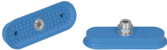
SAOF 90x30 NBR-45 G1/4-AG

La ventosa SAOF disponible en diversos diámetros se suministra con boquilla de conexión vulcanizada en la pieza elastomérica.