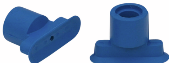
SGO 18x6 HT1-60 N021