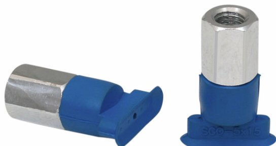
SGON 15x5 HT1-60 M5-IG