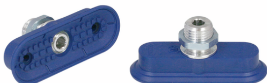
SAOF 60x23 NBR-60 G1/4-AG

La ventosa SAOF disponible en diversos diámetros se suministra con boquilla de conexión vulcanizada en la pieza elastomérica.