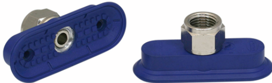
SAOF 60x23 NBR-60 G1/4-IG

La ventosa SAOF disponible en diversos diámetros se suministra con boquilla de conexión vulcanizada en la pieza elastomérica.