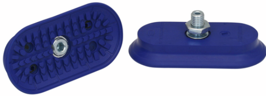
SAOF 100x50 NBR-60 M10-AG

La ventosa SAOF disponible en diversos diámetros se suministra con boquilla de conexión vulcanizada en la pieza elastomérica.