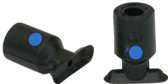
SGO 12x4 NBR-CO-55 N020