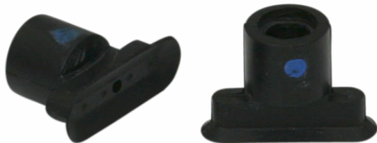
SGO 18x6 NBR-CO-55 N021