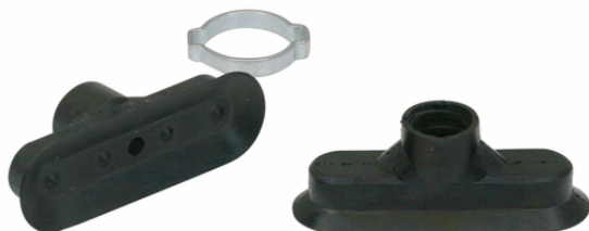
SGO 60x20 NBR-55 N023