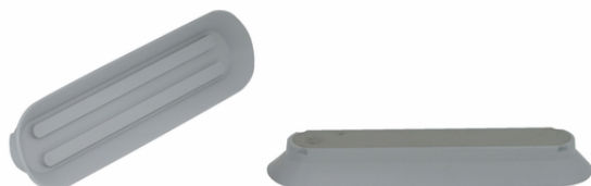
SPLO 150x55 NBR-55

様々なサイズをラインアップし、未吸着パッドのエア漏れを防ぐタッチバルブ付きタイプも選択することができます。