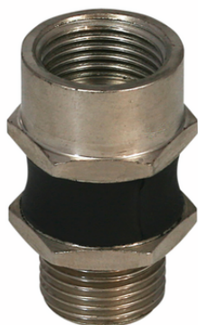
FLK G1/2-IG G1/2-AG

El alojamiento articulado Flexolink FLK se suministra como producto listo para su conexión.