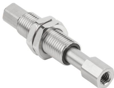
FSTIm M5-IG M5-IG A 20 IN

L'asta a molla FSTIm viene fornito come prodotto finito per connessione.