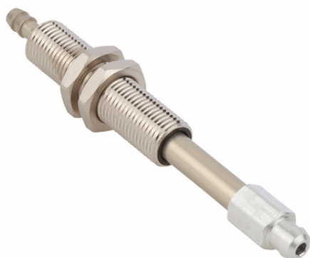
FSTIm N016 6/4 A 20 IN