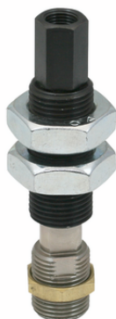
FSTI G3/8-AG G1/8-IG 10 VG

La biela elástica FSTI se suministra como producto listo para su conexión.