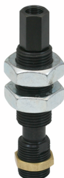
FSTI G3/8-AG G1/8-IG 10