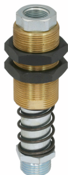
FSTE G1/2-AG 25

L'asta a molla FSTE viene fornito come prodotto finito per connessione.