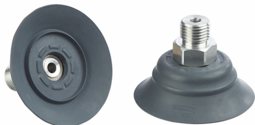
SHFN 50 NK-45 G1/4-AG E