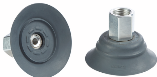
SHFN 50 NK-45 G1/4-IG E

真空パッド SHFNは、パッドにネジが取り付けられた状態で納品されます。以下の製品で構成されます。