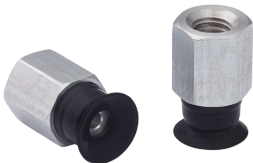
SUF 6 SI-CO-55 M5-IG

La ventouse SUF (partie en élastomère + raccord) est livrée assemblée.