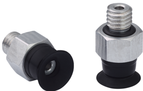
SUF 8 SI-CO-55 M5-AG

La ventouse SUF (partie en élastomère + raccord) est livrée assemblée.