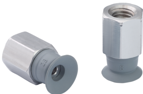
SUF 6 NBR-55 M5-IG

La ventouse SUF (partie en élastomère + raccord) est livrée assemblée.