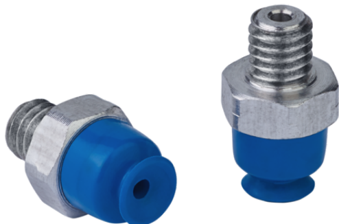
SUF 4 HT1-60 M3-AG

Der Sauggreifer SUF (Elastomerteil + Anschlussnippel) wird montiert geliefert.