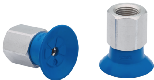
SUF 15 HT1-60 M5-IG

La ventosa SUF (parte in elastomero + nipplo di connessione) viene fornita montata.